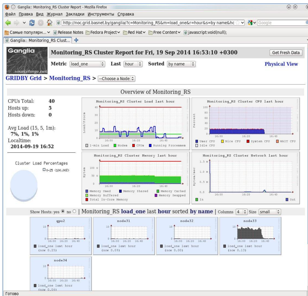
Рис. 1. Система мониторинга грид-сайта Monitoring_RS